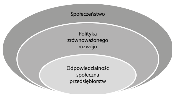
Rys. 2. Zrównoważony rozwój jako pojęcie szersze niż odpowiedzialność społeczna przedsiębiorstw Źródło: opracowanie własne.