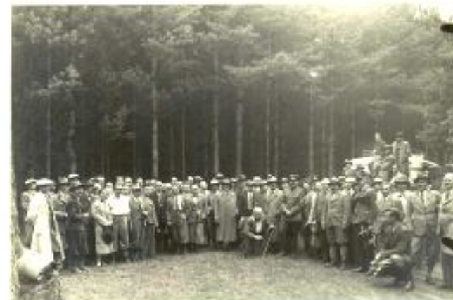
Zdjęcie ze Zjazdu Absolwentów Sekcji Leśnej Wydziału Rolniczo-Leśnego Uniwersytetu Poznańskiego na tle zespołu leśnego „Maruszką” w Zielonce w 1935 r.

Jednym z zadań Związku jest utrzymanie i wzmocnienie łączności i węzłów przyjaźni zadzierżgniętych w czasie studiów, co osiąga się przez częsty stały kontakt członków między sobą.