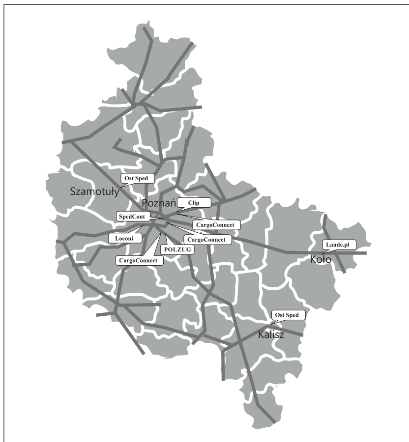
Ryc. 2. Lokalizacja terminali intermodalnych w województwie wielkopolskim