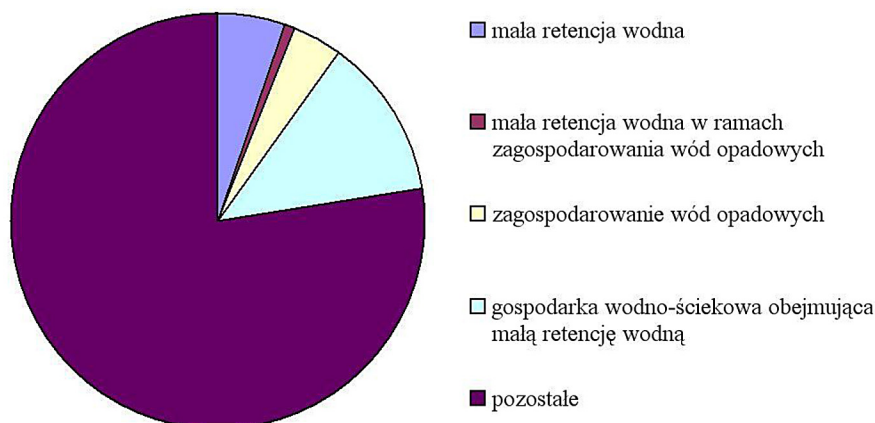
Rys. 3. Udział zadań w programach ochrony środowiska gmin nadwarciańskich Fig. 3. Tasks content in the local environmental protection programs

środków i możliwości) nabiera jednak znaczenie w kontekście priorytetowego traktowania innych obszarów – budowy kanalizacji sanitarnej i oczyszczalni ścieków, gdyż są to działania bardzo absorbujące w zakresie administracyjno-proceduralnym (pozyskanie środków, procedura przetargowa, nadzór nad inwestycją). Wydaje się również, że jednym z czynników ograniczających odpowiednio silne zaakcentowanie tych obszarów w analizowanych programach mógł być brak silnej motywacji np. w postaci odgórnie narzuconych procedur, możliwości wykorzystania środków zewnętrznych, nacisków lub choćby zapotrzebowania społecznego, względów politycznych.